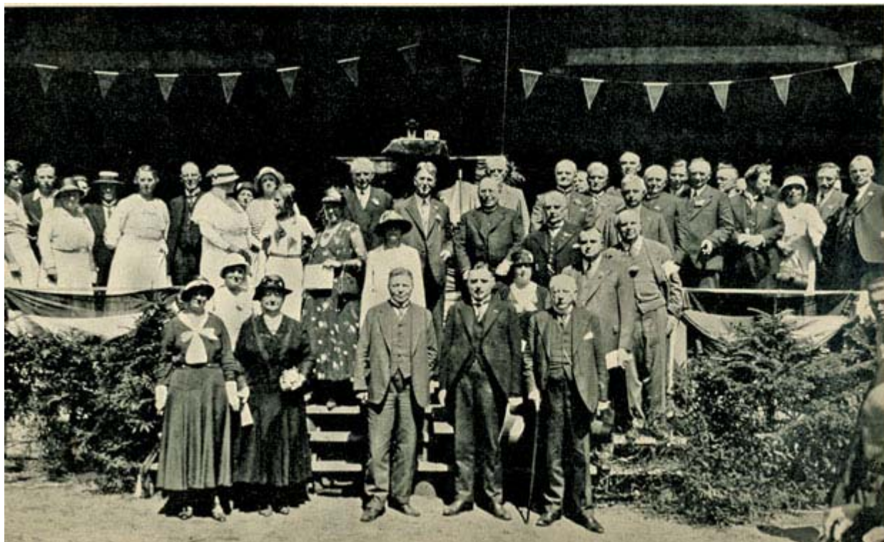
Bij het begin van de pauze werd een goed geslaagde foto genomen van de autoriteiten en bestuursleden met hun aanwezige dames.