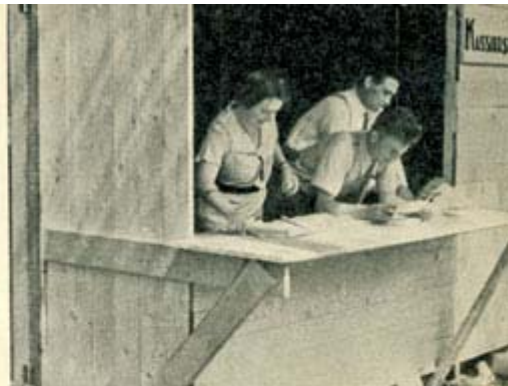
De „Kassierstent“, het financiële landdag-centrum, waar de gelden der diverse diensten werden verzameld en waar de contrôle plaats had.