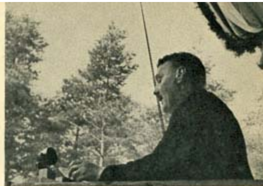
Mr. Dr. J. Donner, oud-Minister van Justitie, sprak een kort maar krachtig woord.