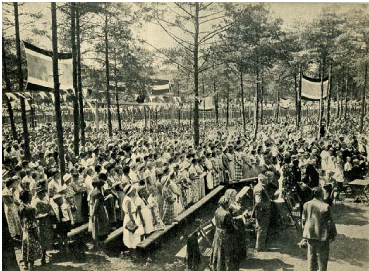
Mchtig klonk het landdaglied, door de ruim 60.000 aanwezigen gezamenlijk gezongen. Opdenvoorgrond medewerkende zongverenigingen.