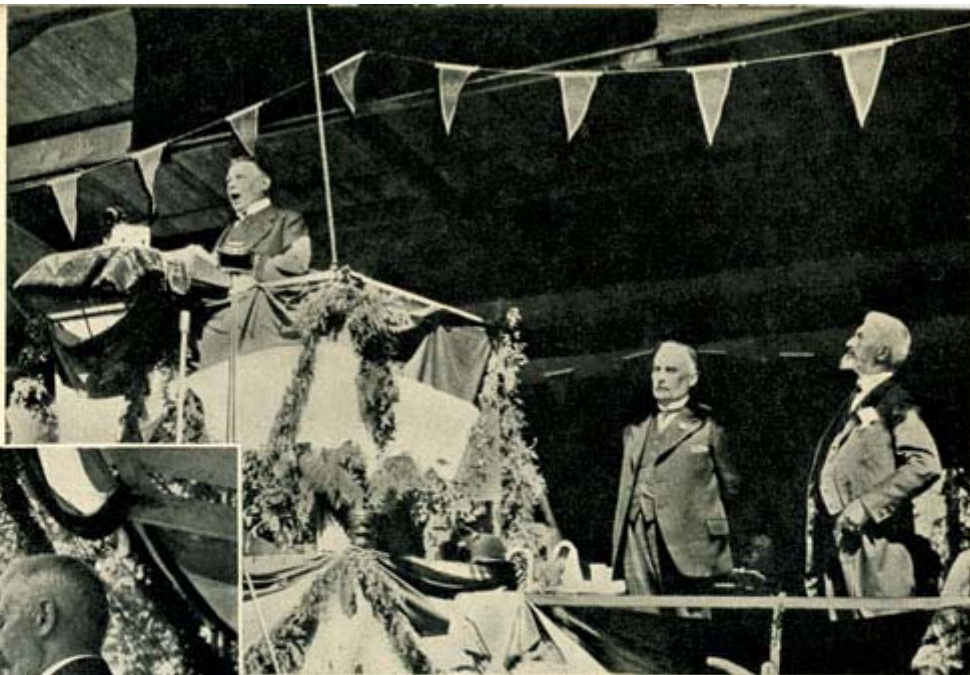
Z.Exc. Mr. J. A. de Wilde, Min.van Binnenl. Zaken, tot wiens ressort ook de radio-omroep behoort, sprak een warm woord voor de N.C.R.V.