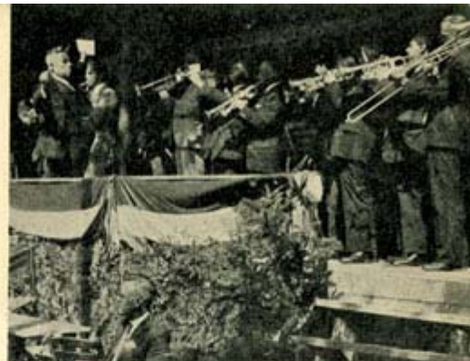
Bazuïngeschal. Een indrukwekkende inleiding van het officieele gedeelte van den Nationalen Radio-landdag der N. C. R. V.

Onder het spelen van een marsch had de vaandeloptocht naar de tribune plaats. Op den voorgrond een apparaat voor het opnemen van 'n geluidsfilm.