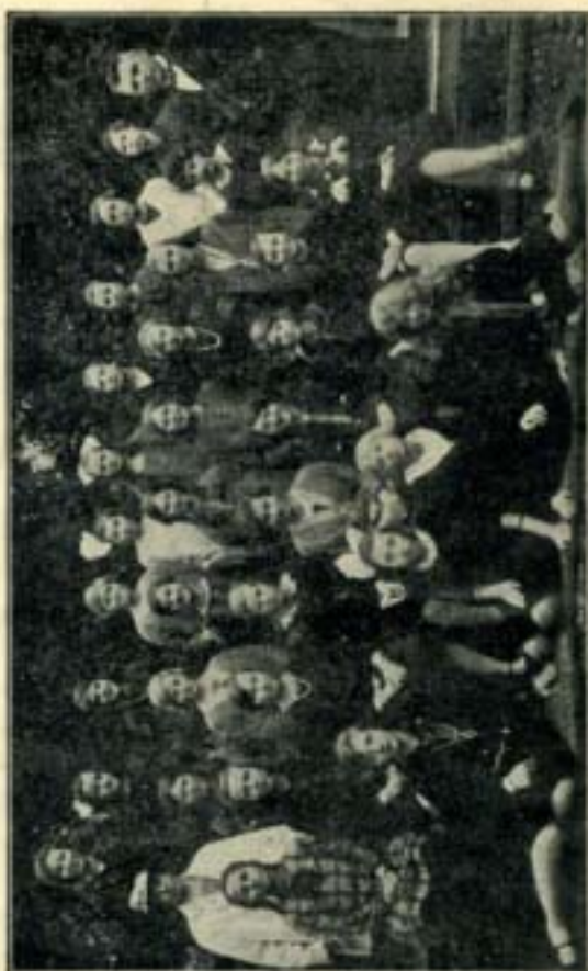
Deel van het Meisjeskoor „Het Harpje“