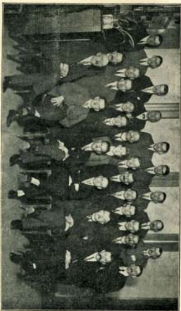
Apeldoorn's Christelijk Mannenkoor