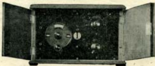
RUMOL B 4

met afgeschermdde spoelen en verlichte schaal, zeer eenvoudig te bedienen