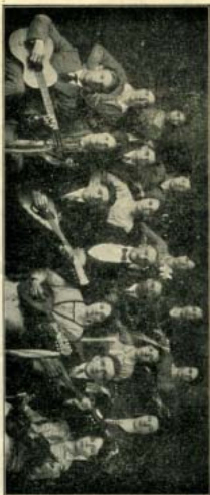
Chr. Mandolineclub „Deo Juuente“

Wacht verband lid of Directeur van „Deo Juuente“