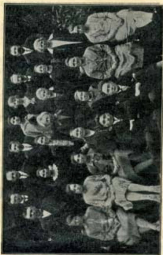
Evangelisatiekoor „De Blijde Boodschap“