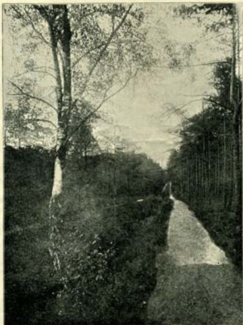
Gezicht in Berg en Bosch.