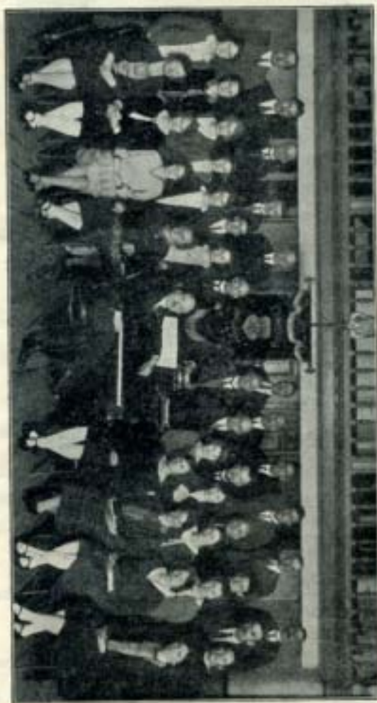
Chr. Zangvereniging „Concordia“