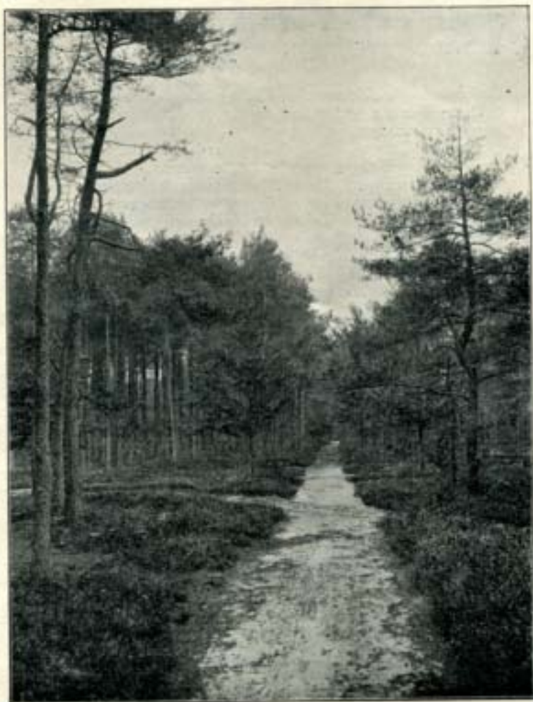
Laantje in het Wollenbosch