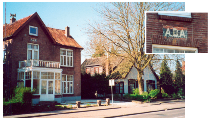
Deventerstraat 94. Eertijds het hoofdkantoor van de autobusdienst.

In 1993 verschenen de eerste ideeën ('Beeldvisie') voor de ontwikkeling tot woongebied van het bedrijfsterrein van Welgelegen tussen kanaal en Deventerstraat. In 1997 volgde het bestemmingsplan Kanaaloevers Park. Dwars door het gebied was een deel van de oostelijke ringweg geprojecteerd, de Quarles van Uffordlaan. Veel oude panden zouden moeten worden afgebroken. De aanleg van de ringweg was een pijnpunt voor velen, vooral als het ging om de noodzaak ervan, maar ook de ligging. De toenmalige Wijkraad van Welgelegen was uiteindelijk voorstander van de aanleg van de weg. 'Die weg was noodzakelijk om de groeiende verkeersstroom op te vangen...!', aldus de toenmalige voorzitter Linthorst.